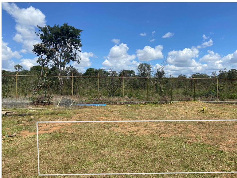
Figura 2: Imagem do local de instalação dos containers, com sugestão de posicionamento da estrutura no terreno.